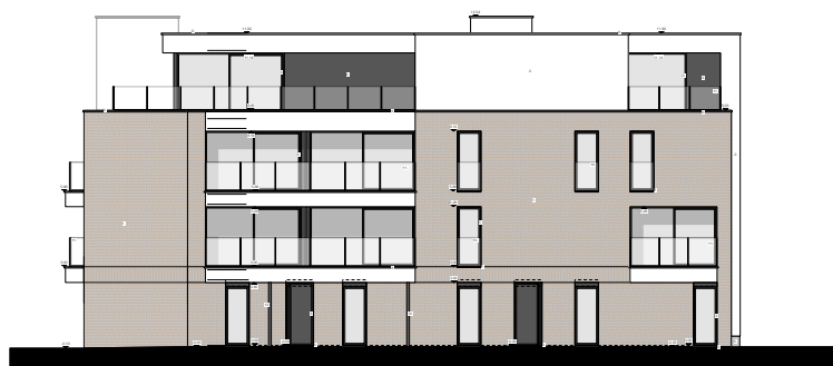
VOORGEVEL - RUBENSLAAN