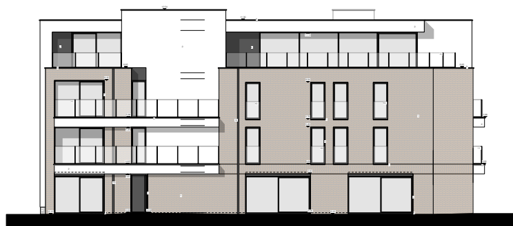
VOORGEVEL - RODENBACHLAAN